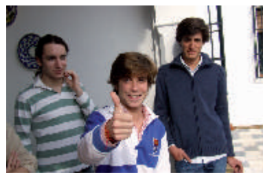
Receso en la convivencia de estudio