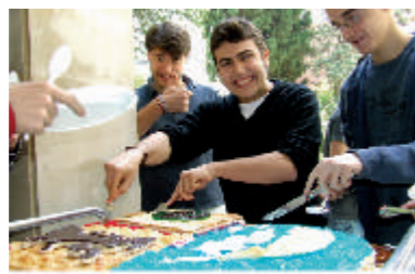
Tarta de la fiesta del 60 Aniversario