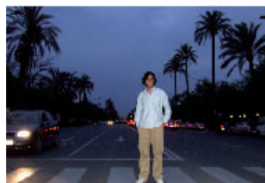
Curro desafiante en la Palmera