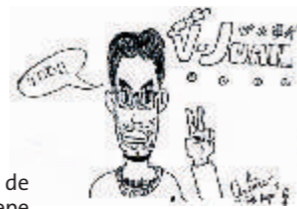
Gráficos de Tío Pepe